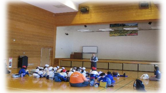
南部小学校のみなさん