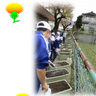
高瀬中学校の種まき